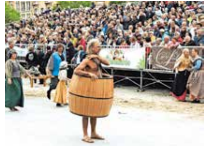
Deze kerel met ton krijgt het publiek op zijn hand.

Na de Kattenstoet was er nog de gebruikelijke kattenworp van op de Belfortoren. Daarbij gooit de stadsnar pluchen katten naar beneden. Dat verwijst naar een gebruik in de middeleeuwen