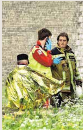
De doorweekte eigenaar van het paard wordt meegenomen naar een EHBO-post.