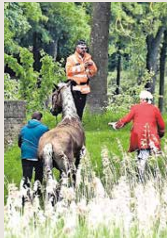
Het paard werd weggeleid naar drogere oorden.

dat door allerlei leperse verenigingen. 21 taferelen werden door niet-leperse verenigingen in beeld gebracht. Aan de stoet gingen maar liefst 100 repetities vooraf. Alle 4.900 plaatsen op de tribunes waren uitverkocht. De stoet rijdt over drie jaar weer uit.