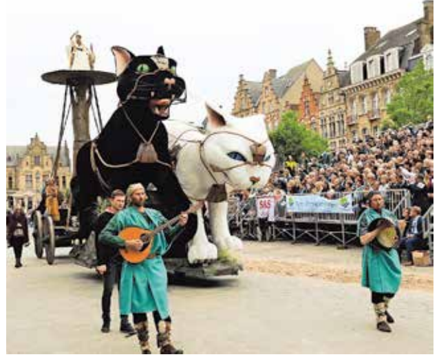
Het publiek verveelde zich geen seconde met de vele groepen en mooie kostuums.

pen Jef Verschoore (CD&V). «Alle groepen waren goed gespreid. De nieuwe kostuums kwamen goed naar voor en alle figuranten bleven zicht tot op het einde inspannen.» Gwendolina Dewulf (45) en Wim Dolphen (45) uit Kortemark beamen de woorden van descheperen. «We waren wat laat in leper, maar we hebben gelukkig nog een goed plaatsje gevonden om alles te bekijken», aldus het koppel. «Het is alle-