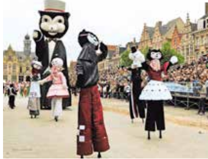
Cieper met zijn vijf kittens.