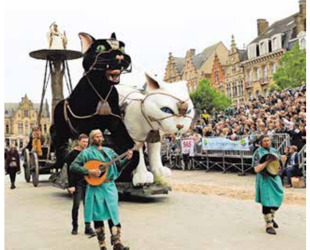
Het publiek verveelde zich geen seconde met de vele groepen en mooie kostuums.

pen Jef Verschoore (CD&V). «Alle groepen waren goed gespreid. De nieuwe kostuums kwamen goed naar voor en alle figuranten bleven zicht tot het einde inspannen.» Gwendolina Dewulf (45) en Wim Dolphen (45) uit Kortemark beamen de woorden van descheper. «We waren wat laat in leper, maar we hebben gelukkig nog een goed plaatsje gevonden om alles te bekijken», aldus het koppel. «Het is alle-