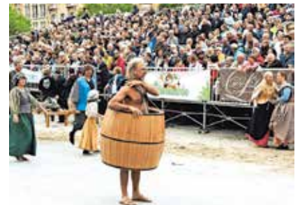
Deze kerel met ton krijgt het publiek op zijn hand.

Na de Kattenstoet was er nog de gebruikelijke kattenworp van op de Belfortoren. Daarbij gooit de stadsnar pluchen katten naar beneden. Dat verwijst naar een gebruik in de middeleeuwen